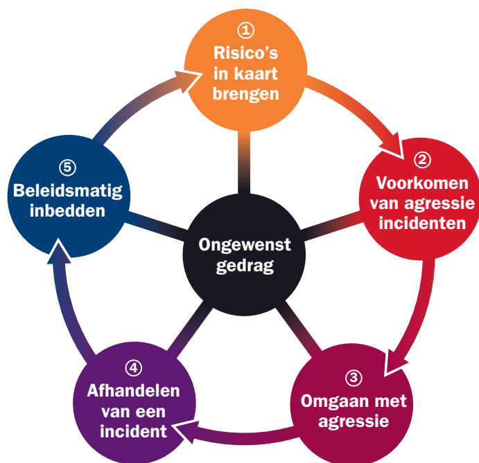
Figuur 1: De beleidscyclus bij ongewenst gedrag in 5 stappen

De werkgever is verplicht het werk zodanig te organiseren dat het geen gevaren met zich mee kan brengen voor de veiligheid en gezondheid van de medewerker. De or kan hierbij beleidsmatig sturen en invloed uitoefenen. Bij de beleidsmatige aanpak van ongewenst gedrag is het raadzaam om een logische volgorde te kiezen. De beleidscyclus kun je opdelen in vijf stappen. Allereerst moet je als or de risico's in kaart brengen (stap 1). Vervolgens kun je maatregelen nemen om agressie te voorkomen (stap 2). Vindt er ondanks de maatregelen toch agressie plaats, dan moet je vastleggen wat je als organisatie op zo'n moment doet (stap 3). Wat doe je vervolgens na een incident (stap 4)? En tot slot: hoe zorg je ervoor dat het beleid ook wordt uitgevoerd (stap 5)?